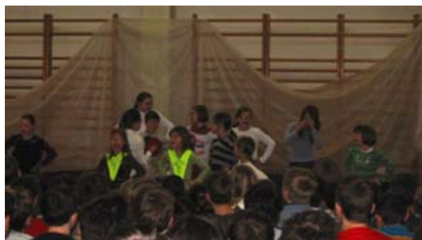
Utrinek s šolske prireditve ob slovenskem kulturnem prazniku.

Tako je zapisal France Prešeren, naš največji slovenski pesnik, ki se je rodil 3. decembra 1800 v Vrbi na Gorenjskem. V čast njemu in kulturi praznujemo Slovenci 8. februarja slovenski kulturni praznik. In tako je bila v počastitev tega dneva v četrtek, 5. februarja, kulturna prireditev tudi na Osnovni šoli Dobrna. V njej so sodelovali učenci OŠ Dobrna in otroci Vrtca Dobrna. Med gosti pa so bili tudi gojenci iz CDUV Dobrna. Posebej pa smo bili med gosti veseli staršev. Na predvečer kulturnega praznika pa smo učenci OŠ Dobrna sodelovali na občinski krajevni prireditvi ob kulturnem prazniku.