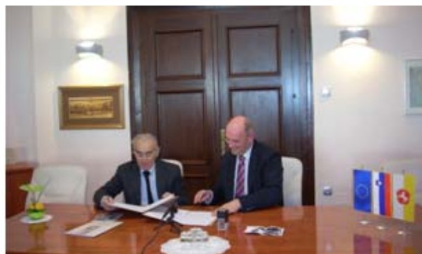
Podpis darilne pogodbe.