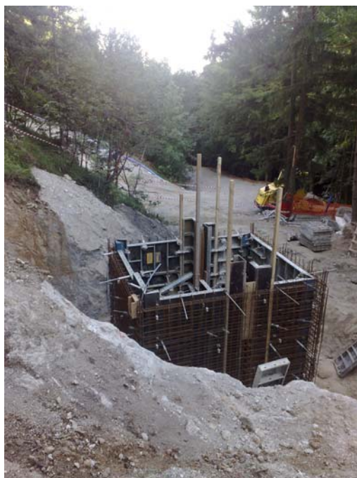
Gradnja raztežilnika Žebljar.

Operacijo »Posodobitev vodovodnega sistema Dobrna–Loka, Lokovina, Klanc, Parož in Vinska Gora« delno financira Evropska unija (največ v deležu 80,44 % upravičenih stroškov), in sicer iz Evropskega sklada za regionalni razvoj. Operacija se izvaja v okviru Operativnega programa krepitev regionalnih razvojnih potencialov za obdobje 2007-2013, razvojne prioritete »Razvoj regij«, prednostne usmeritve »Regionalni razvojni programi«.