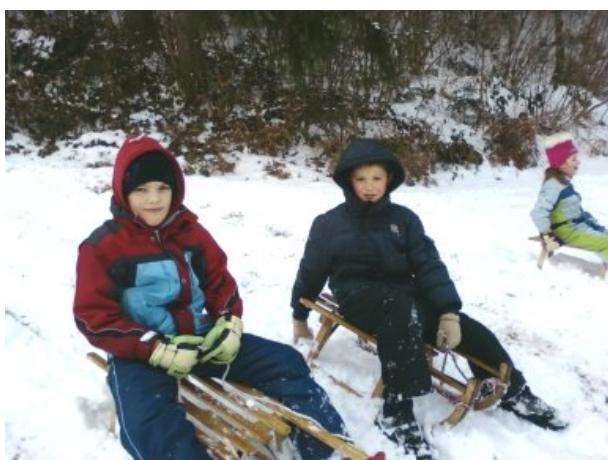
Učenci I. triade na zimskem športnem dnevu.