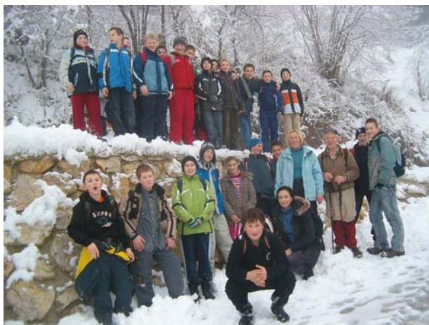
Učenci od 6. do 9. razreda so se odpravili na zimski pohod.