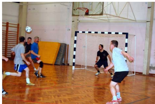
Člani Nogometnega društva Dobrna so prvi preizkusili nove gole v telovadnici OŠ Dobrna.

za šolstvo in šport in Občino Dobrna je bila podpisana v mesecu februarju 2009. V skladu z zakonodajo je bil izveden javni razpis, na katerem je bil izbran najugodnejši ponudnik Elan Inventa, d.o.o.; 24. 2. 2009 so bili goli dostavljeni v telovadnico OŠ Dobrna in predani svojemu namenu.