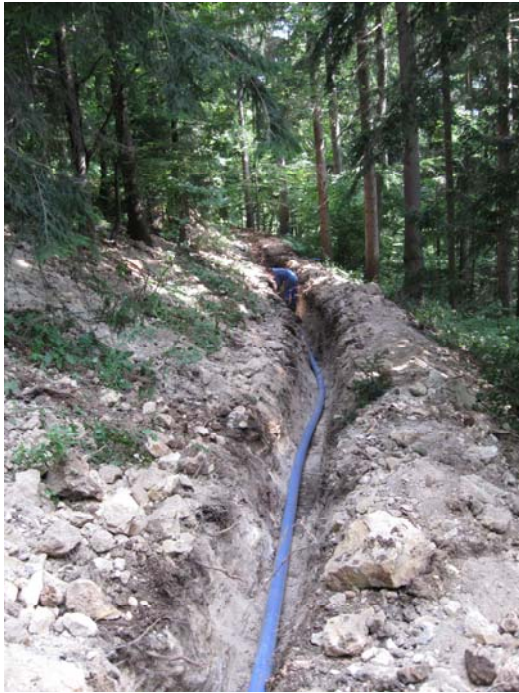
Izgradnja vodovoda na odseku proti vodohranu Miheljok.

Projekt, ki je že v zaključni fazi ima posebno velik pomen za prebivalstvo ogroženega območja, prav tako ima posreden vpliv na ohranjanje poseljenosti podeželja ter razvoj dejavnosti ekološkega kmetijstva, turizma in ostalih dejavnosti na kmetijah.