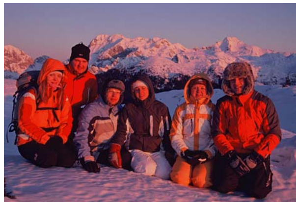
Jutranja zarja na vrhu.