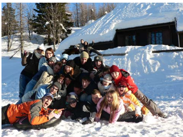
Delovno-zabavni vikend udeležencev MKD.

Spanje na blazinah, kurjenje peči, da nam je bilo toplo, in noči brez elektrike so nas za nekaj dni postavile v okolje stran od moderne civilizacije, prenasičene z udobjem in materialnimi dobrinami. Mi smo se kljub temu dobro znašli in se ob vsem tem tudi zabavali. Motivacija je bila vsekakor na vrhuncu, kar bodo pokazali tudi letošnji projekti v naši izvedbi.