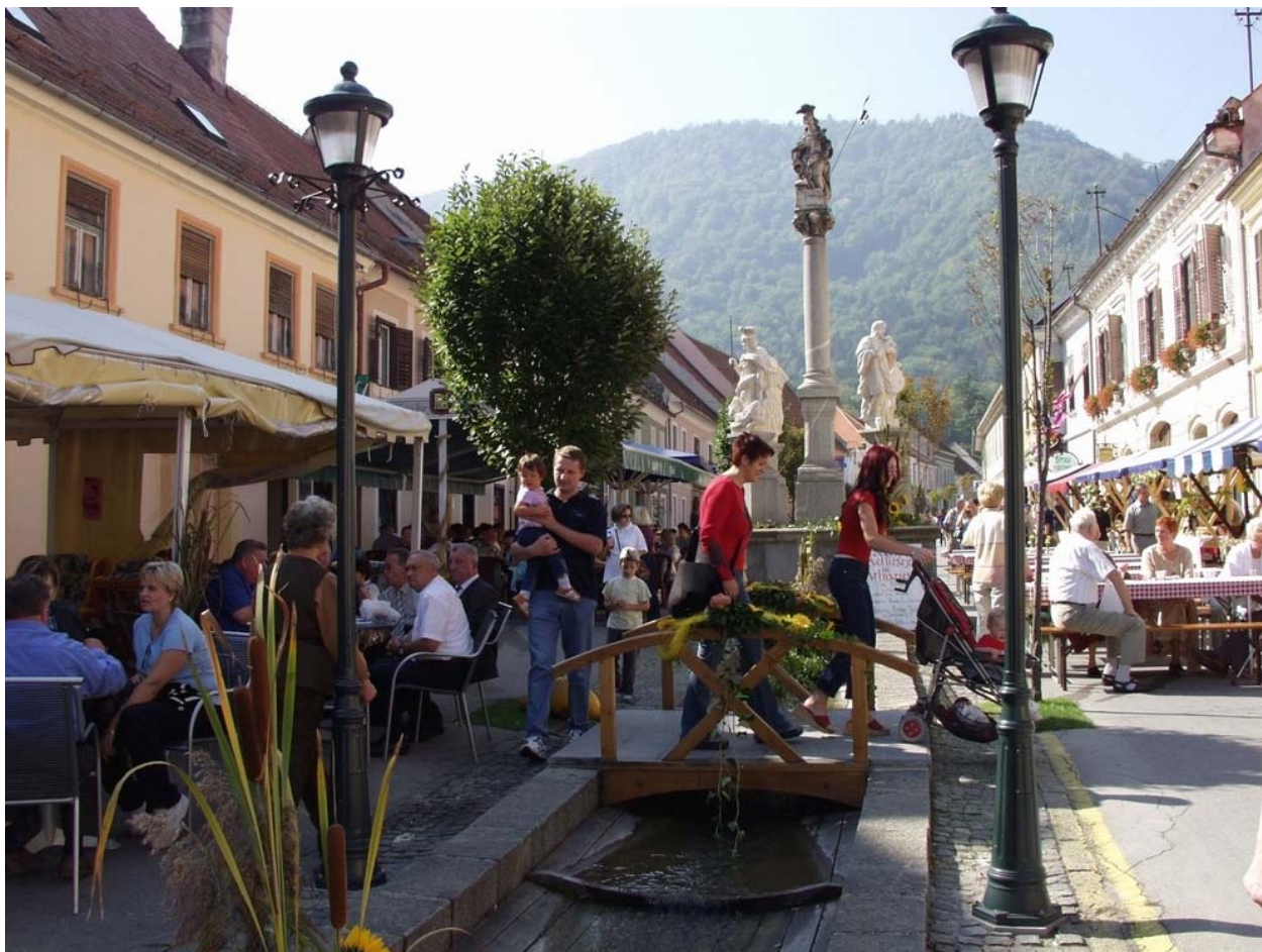
Slika 3: »Trg v Slovenskih konjicah«, Občina Slovenske Konjice

Finančni organ LAS: Krajcar d.o.o., Dramlje 2, 3222 Dramlje