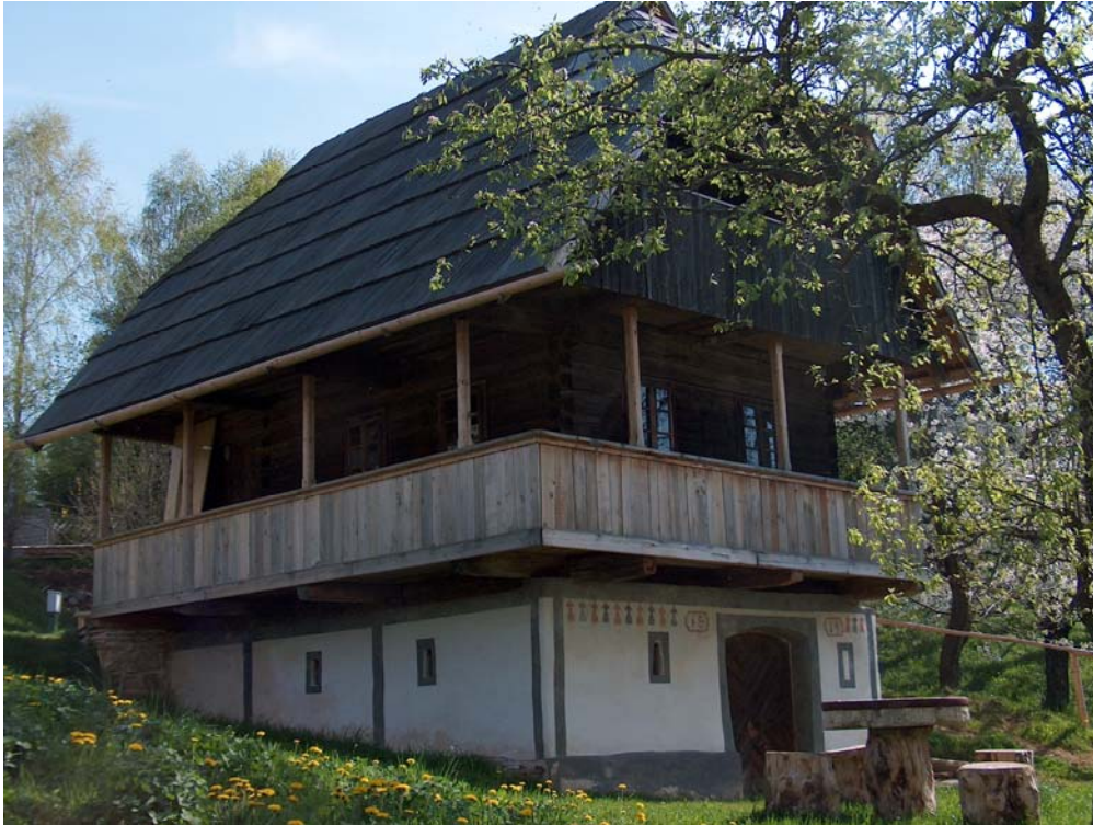
Slika 4: »Beškovnikova Kašča, Vitanje«, Občina Vitanje