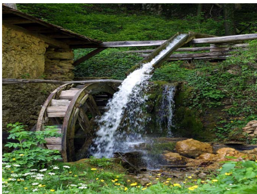
Slika 2: »Mlin na Dobrni«, Občina Dobrna