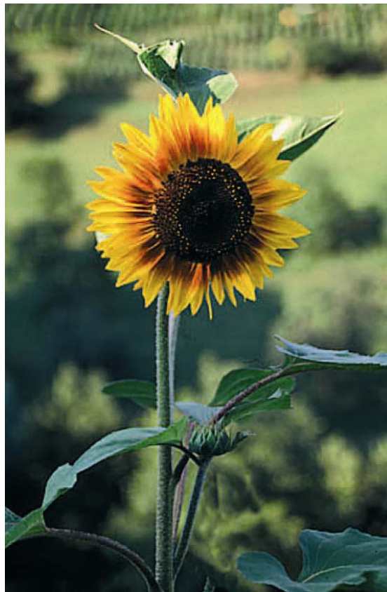
Slika 6: »Sončnica«

Člani Upravnega odbora kot tudi člani komisije za izbor projektov ne bodo smeli prijavljati lastnih projektov. Obenem so člani Komisije in Upravnega odbora zavezani spoštovati zahtevo, da pri njihovem delu v LAS ne sme priti do konflikta interesov. Transparentnost bo poleg z definiranimi kriteriji ocenjevanja projektov zagotovljena tudi z javnostjo delo LAS, saj bodo javno objavljeni vsi podatki o izbranih projektih. Obenem se bo zagotavljala tudi z rednim informiranjem ter dostopnostjo do podatkov o delovanju LAS in izvajanju Strategije s strani članov LAS kot tudi javnosti.