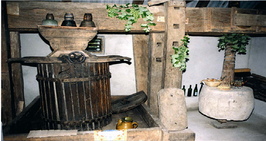
Slika 5: »Preša v Oplotnici«, Občina Oplotnica

opravljenem nadzoru in lahko v primeru hujših kršitev pogodbenih določil predlaga Upravnemu odboru in skupščini odpoved pogodbe z upravljalcem.